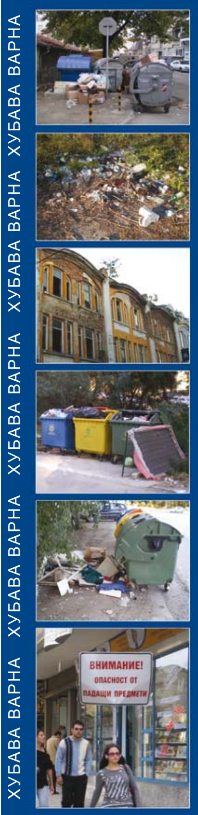
ХУБАВА ВАРНА ХУБАВА ВАРНА ХУБАВА ВАРНА ХУБАВА ВАРНА ХУБАВА ВАРНА